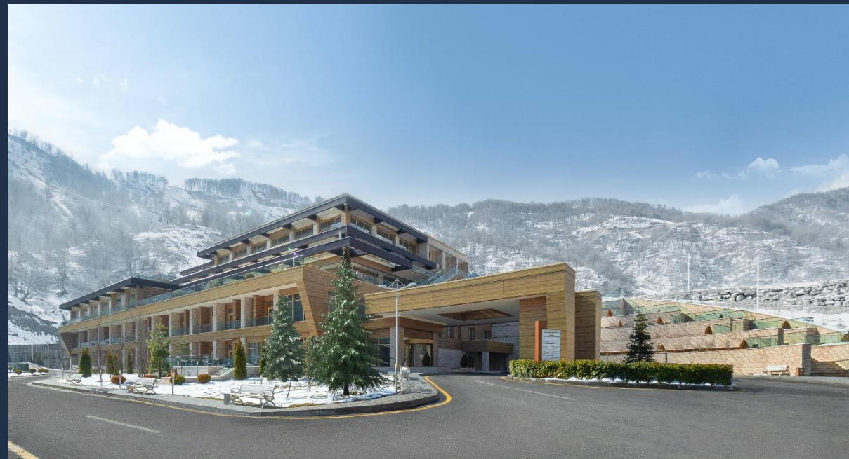
Qafqaz Tufandag Hotel