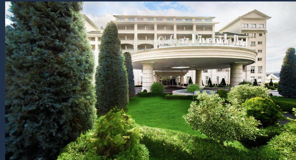
Qafqaz Riverside Hotel