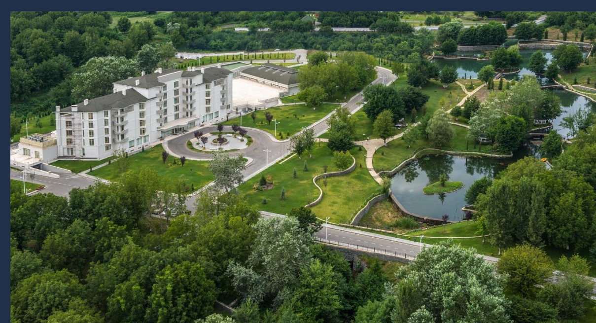
Qafqaz Thermal & SPA Hotel