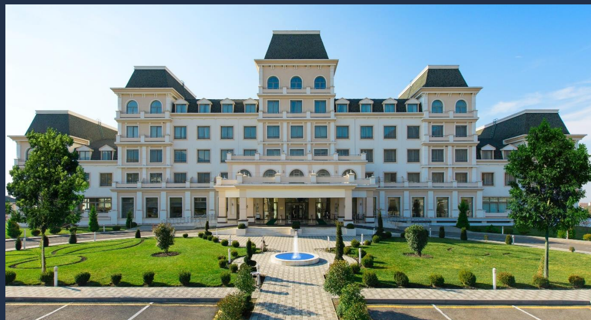
Qafqaz Sport Hotel